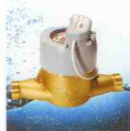
V200/V210, domovní objemový vodoměr s rádiovým komunikačním modulem.