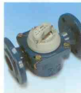
Průmyslový vodoměr S2000, jednotkové měřidlo na studenou vodu s rádiovým komunikačním modulem.