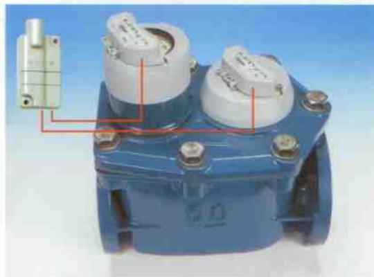
Sdružený vodoměr C4000 s moderním a vodotěsným komunikačním modulem.

V zájmu nejlepší možné kvality dat, jako standardu, ELSTER připravil jak pro domovní, tak pro průmyslové vodoměry moderní snímače s detekcí odstranění kabelu. Dokonalé elektromagnetické odstínění a schopnost rozlišit zpětný tok zajišťuje, že přenášená hodnota je shodná se skutečnou hodnotou spotřeby.